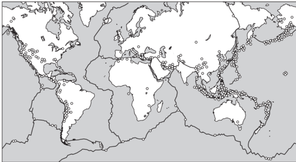
Key ○ earthquake of 2.5 or more on Richter Scale ~ plate boundary